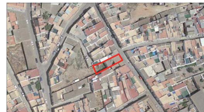
VUELO AÑO 2005