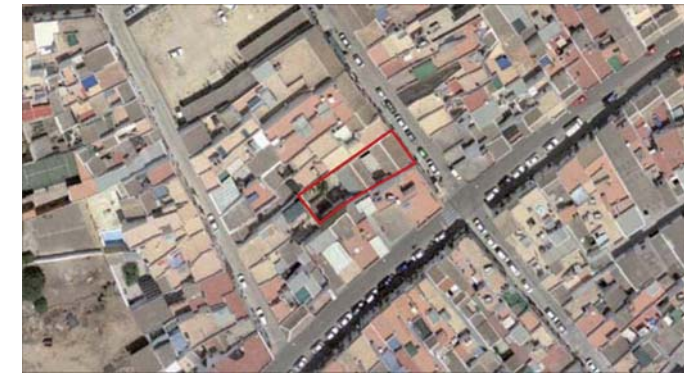
VUELO AÑO 2005