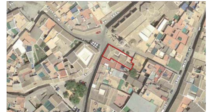
VUELO AÑO 2005