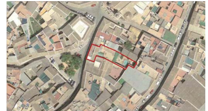
VUELO AÑO 2005