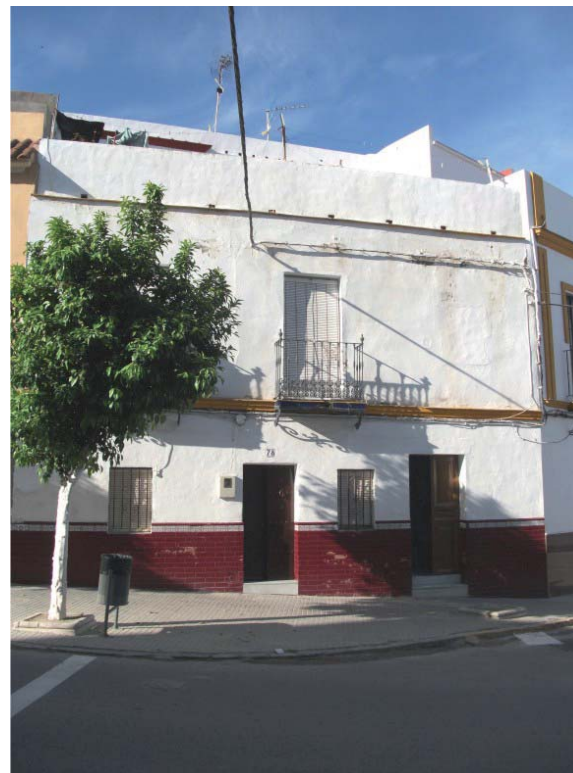
E 1:1.000 FACHADA