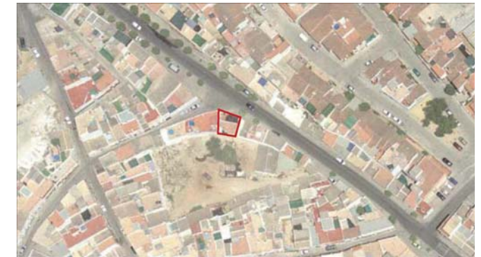
VUELO AÑO 2005