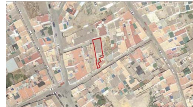
VUELO AÑO 2005